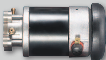
R15 S DC 53