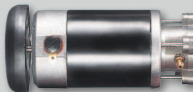
R19 S DC 54

Le pompe per vuoto rotative a palette possono essere fornite in versione con singolo o con doppio corpo pompa.