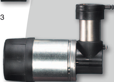
P39 S DC 52