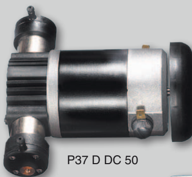
P37 D DC 50